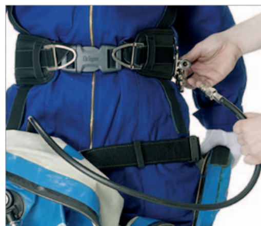
Den Mitteldruckschlauch im Anzuginneren mit der Gürtelgarnitur des Automatischen Umschalters (ASV) verbinden.