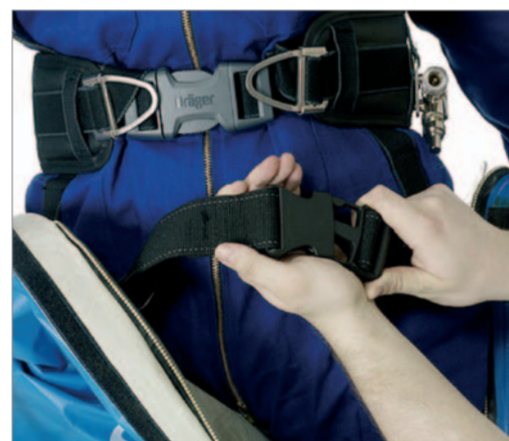
... den integrierten Hüftgurt schließen und an der Verschlusschnalle festziehen.