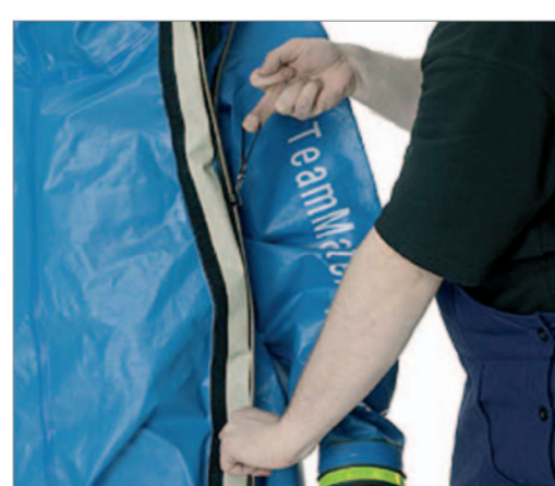
Fällt das Verschließen schwer, den Verschluss ein Stück zurück ziehen und erneut in Schließrichtung führen – ggf. nachfetten.