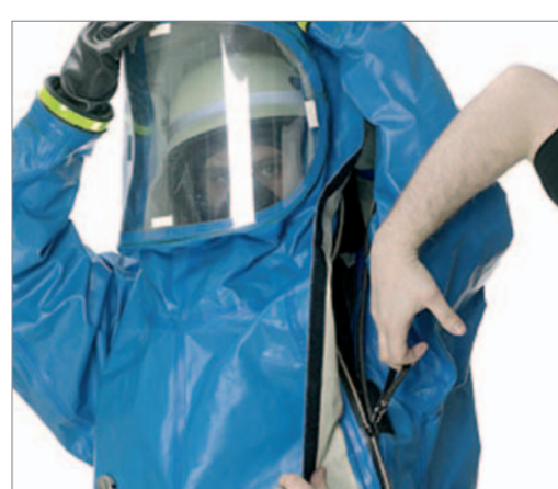
Durch Anheben der Haube können Wellen im Verschluss gerade gezogen werden.