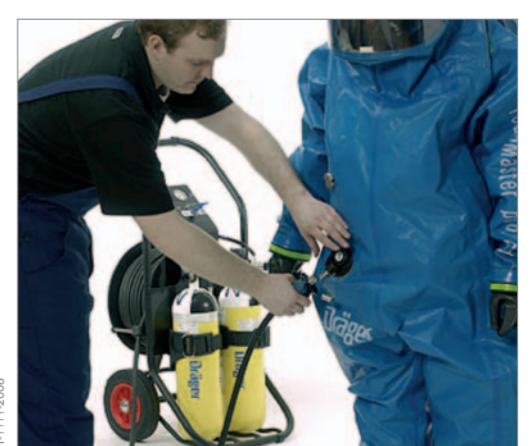
Das Regulierventil PT 120 L ggf. mit einer Druckluftschlauchleitung verbinden.