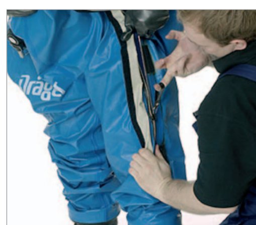
Die Zuglasche nur mit dem Mittelfinger führen, um nicht zu viel Kraft aufzubringen.