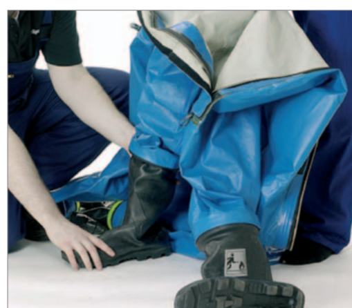
Mit dem rechten Fuß in den rechten Stiefel steigen.