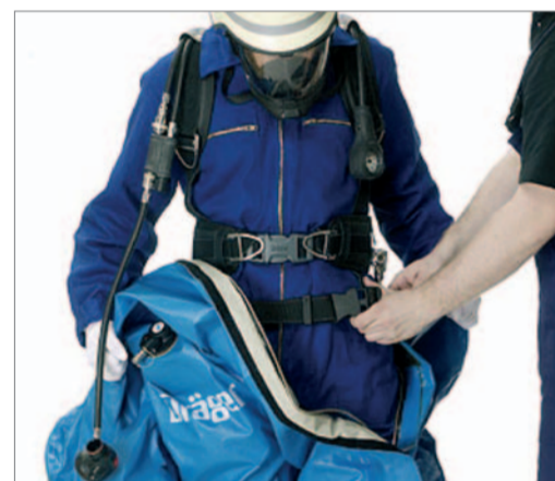
Bei Anzügen mit Ventilationsystem oder Führungsleinenadapter...