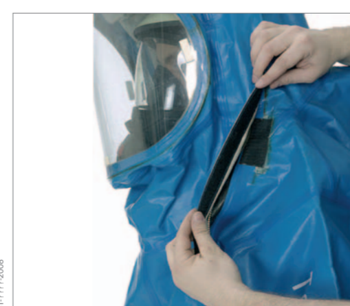
Die Abdecklasche mit den Klettverschlüssen schließen.