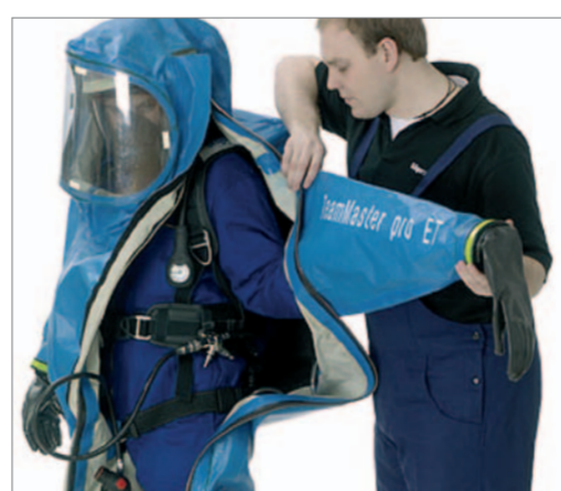
Die linke Hand in den Ärmel und den Handschuh stecken.