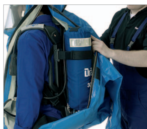
Den Rucksack über den Pressluftatmer führen.