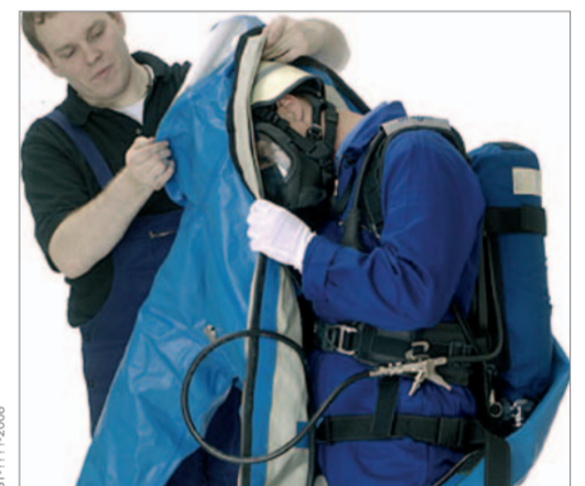
Dabei den Kopf in die Haube führen.