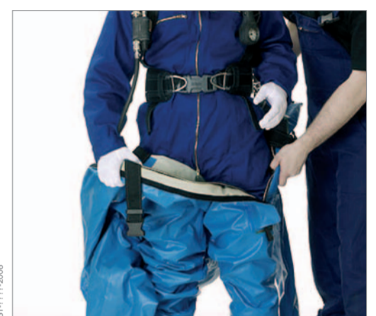
Den Anzug bis zur Hüfte hochziehen.