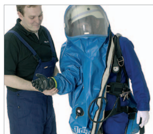
Die Hand in den Handschuh stecken.