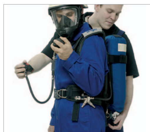
Vor dem Anlegen Flaschenventil öffnen und Funktion des Pressluftatmers prüfen.