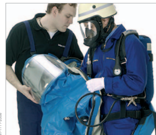
Den rechten Arm in den Ärmel stecken.